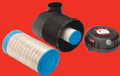
OptiAir - Система забора воздуха